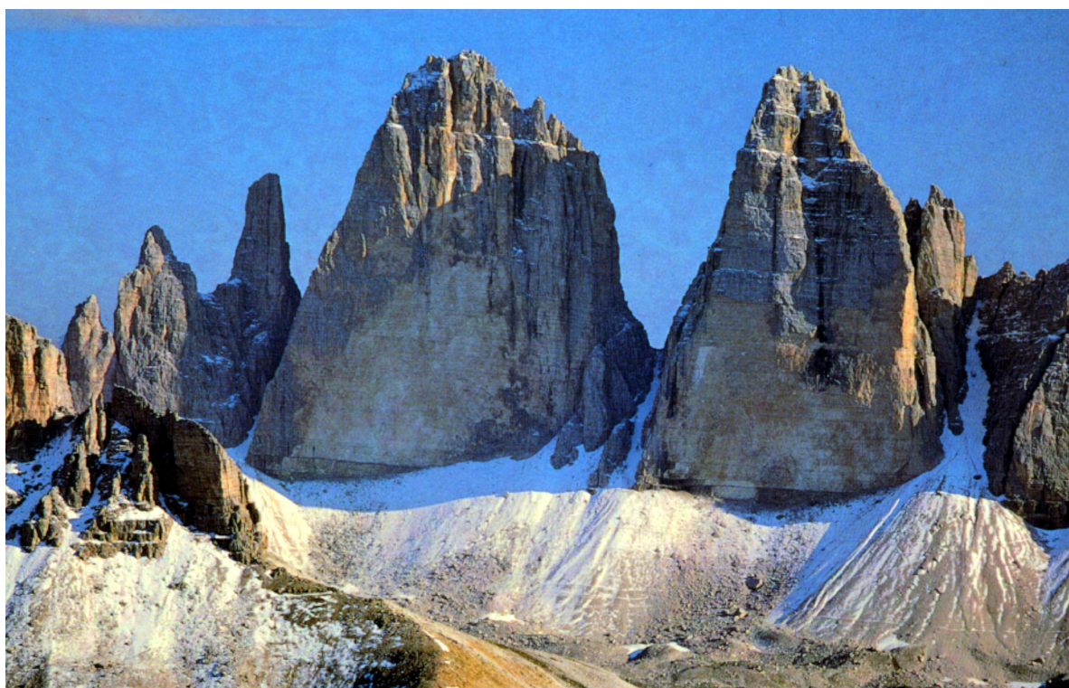
La Cima Grande au centre La Dibona longe l'arête à gauche sur le versant caché.