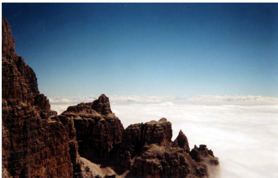
Via ferrata de la Bochetta

Là un parking (payant à partir de 7 ou 8 heures le matin) permet de laisser la voiture et de faire les 1200 mètres de dénivellés pour atteindre le refuge Brentei , puis la brèche degli Armi (2749m) où il reste 30 minutes en passant par le refuge Alimonta .