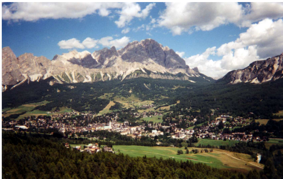
Vue de Cortina

Le camping se trouve en bas à droite dans les arbres le long de la rivière