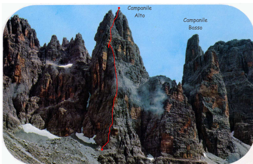
Le campanile Alto.