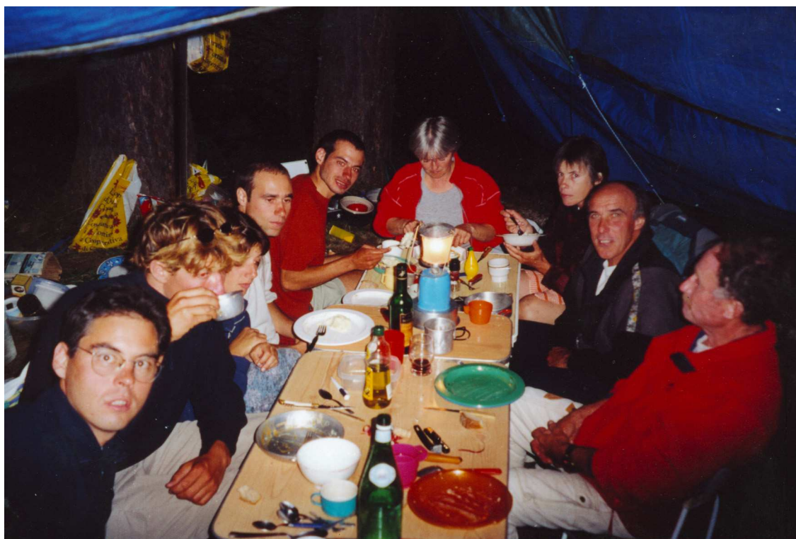
Le repas du soir à Cortina

Le moral commence à faiblir, l'humidité a envahie les tentes et duvets, mais heureusement un campement bien installé nous permet de résister.