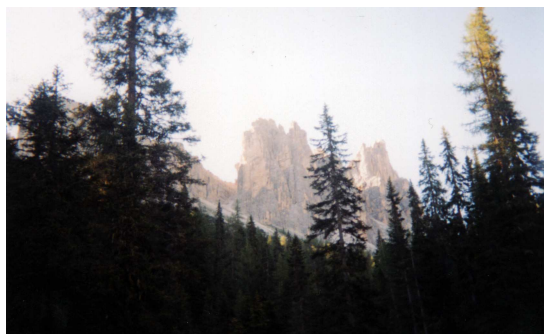
Cima Cason di Formin