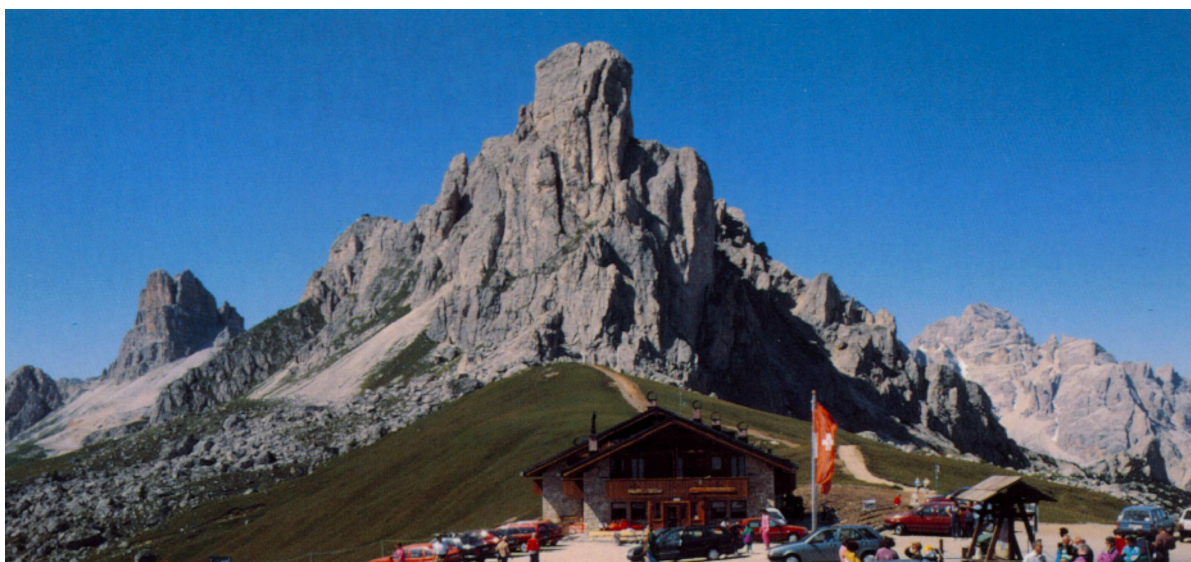
Le Passo Giau avec son Chalet restaurant

Passo Giau (2233m) accès 30 minutes en voiture depuis Cortina , Voie Gusela 250m D (1 cordée) 10 minutes d'approche, 1 heure de descente.