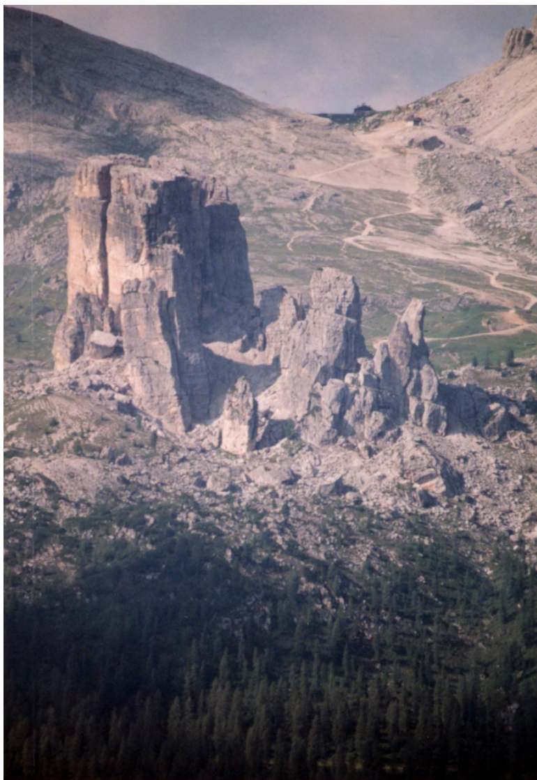
Cinqué Torri (2366m)

Nous avons parcouru : Torre Lusy 100m AD+, Torre Del Barancio 120m D+, et de nombreuses moulinettes entre deux averses.