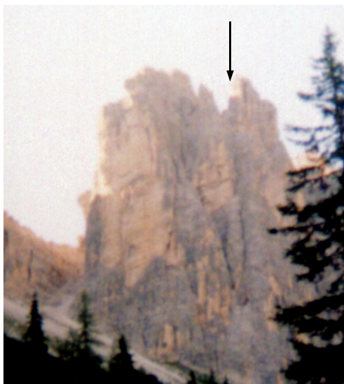
On distingue le Dièdre Dallago sous la flèche

Accès 20 minutes depuis Cortina en voiture, 1h20 d'approche, 4 heures d'escalade, et 2 heures pour la descente.