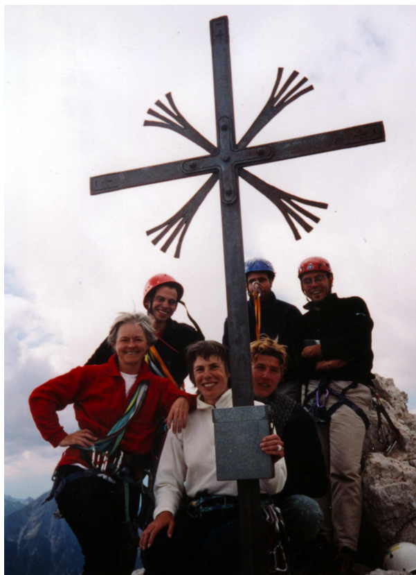
Le groupe au sommet de la Cima Grande