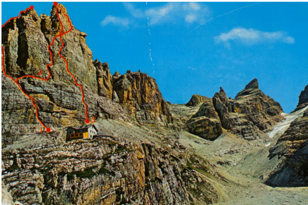
Castelletto di Mezzo