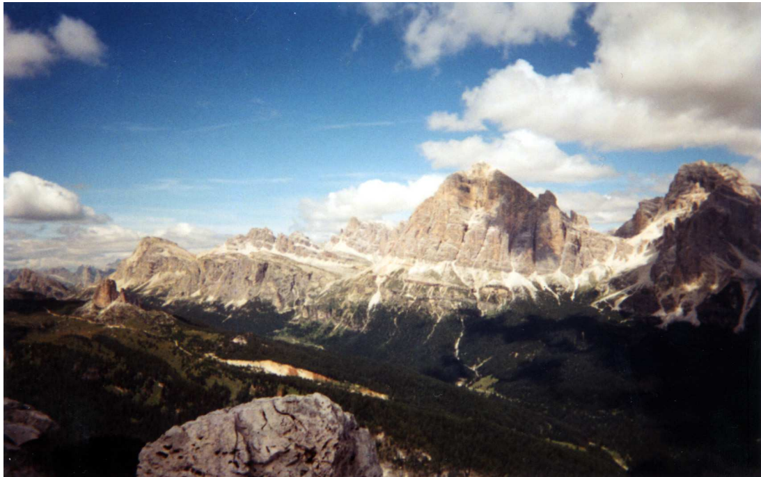
Tafana di Rozes

Sigolo SW 400m TD- à 20 mn de Cortina en voiture, 1 heure d'approche, 5h d'escalade, 1h de descente. (2 cordées de Jeunes)